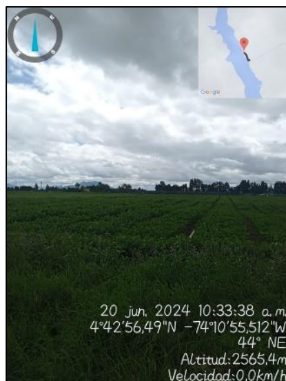
Ilustración 5. Actividad agrícola

En el predio se realizan actividades agrícolas, como se observa en la siguiente ilustración: