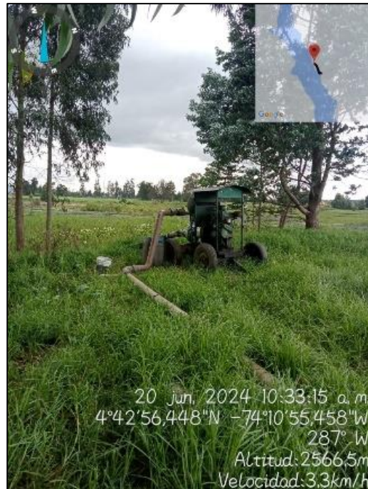
Ilustración 3. Motobomba en la ronda del humedal