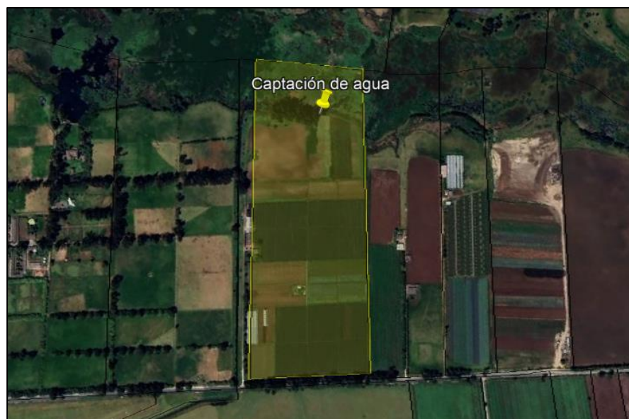
Ilustración 2. Ubicación del predio

C.P. 250020 Tel. +57(1) 823 40 70 823 40 71 / 823 40 73 Fax. + 57(1) 825 76 20 Dir. Cra. 14 No. 13-05