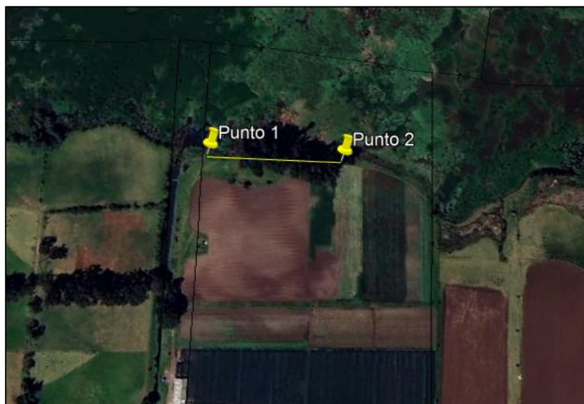
Ilustración 1. Recorrido

El día 20 de Junio de 2024, se realizó recorrido de control y vigilancia en la ronda del humedal Gualí, vereda Hato (Ruta amarilla), ecosistema que fue declarado por la Corporación Autónoma Regional de Cundinamarca - CAR como Distrito Regional de Manejo Integrado a través del acuerdo 001 de 2014 "Por medio del cual se declaran como Distrito Regional de Manejo Integrado (DMI), los terrenos comprendidos por los humedales de Gualí, Tres Esquinas y Lagunas de Funzhé, y su área de influencia directa ubicada en los municipios de Funza, Mosquera y Tenjo, Cundinamarca", y estableció tres zonas: 1. Preservación (espejo de agua), 2. Recuperación (50 metros) y 3. Uso sostenible (100 metros), con el fin de identificar presuntas afectaciones ambientales.